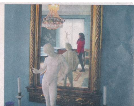
MÖBLER. Husets inredning är från 1700- och 1800-talet.