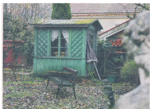
EN KOPP TE? Det gröna lilla tehuset står fortfarande kvar i trädgården.